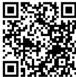
Gambar 1. Barcode E-LKPD

Ahli materi, ahli media, dan praktisi melakukan validasi terhadap hasil akhir media pembelajaran E-LKPD menulis cerpen berdasarkan desain yang telah dihasilkan. Untuk mengetahui apakah media tersebut layak dan menarik, maka diujicobakan kepada peserta didik kelas XI di SMK Negeri 1 Belitang Madang Raya. Setelah itu, media tersebut diperbaiki berdasarkan komentar yang diberikan oleh para validator. Produk yang dihasilkan berupa media pembelajaran E-LKPD menulis cerpen. Media pembelajaran E-LKPD yang dibuat ini terdapat gambar sebagai penunjang atau penguat pemahaman peserta didik mengenai materi menulis cerpen tersebut. Siswa terbantu dalam pembelajaran mereka dengan gambar-gambar yang diberikan. Sebagai hasilnya, ide di balik konten ini adalah bahwa siswa harus dapat menarik kesimpulan mereka sendiri dengan menganalisis foto-foto yang diberikan sebagai contoh di beberapa halaman. Produk media E-LKPD menulis cerpen dikembangkan peneliti menggunakan website Flipbook tujuannya supaya peserta didik dapat mengakses melalui gawai atau handphone masing-masing. E-LKPD tersebut dapat diakses dengan cara scan barcode di bawah ini.