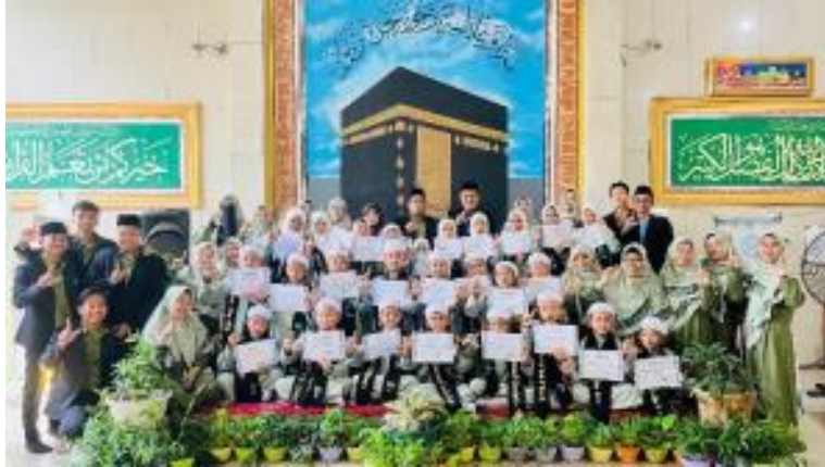
Gambar 2. Apresiasi sekolah kepada siswa dalam Ekstrakurikuler Tahfidz

Studi dokumen menunjukkan bahwa catatan prestasi siswa dan laporan kegiatan ekstrakurikuler mencantumkan penghargaan yang diberikan terkait penerapan nilai-nilai toleransi. Pengamatan pembelajaran terlihat dari cara siswa mengamati perilaku teman-teman dan guru mereka selama kegiatan bersama, seperti diskusi kelompok dan permainan peran. Observasi menunjukkan bahwa siswa belajar dengan mengamati interaksi yang mencerminkan toleransi dan pengertian antarsesama.