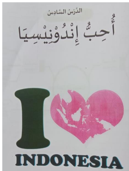
Gambar 2. Buku Bahasa Arab Kelas 4 Materi Uhibbu Induuniisiyaa Halaman. 74-81

Buku Bahasa Arab yang digunakan di MI kelas 4 memuat 6 materi pelajaran berupa materi: (1) Al Unwanu, (2) Al Mihnatu, (3) Al Amalii, (4) Af Raadul Ustrati, (5) Fiil Baiiti, (6) Uhibbu Induuniisiyaa). Dari ke-6 materi pelajaran, materi Uhibbu Induuniisiyaa mencerminkan prinsip moderasi beragama. Sebagai contoh pada gambar 2 berikut: