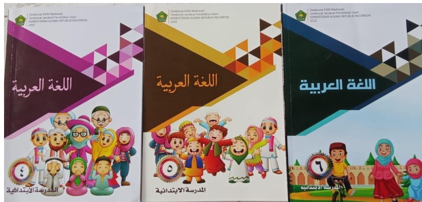
Gambar 1. Gambar Buku Bahasa Arab kelas 4,5,6

Buku Bahasa Arab yang digunakan di MI kelas 4 memuat 6 materi pelajaran berupa materi: (1) Al Unwanu, (2) Al Mihnatu, (3) Al Amalii, (4) Af Raadul Ustrati, (5) Fiil Baiiti, (6) Uhibbu Induuniisiyaa). Dari ke-6 materi pelajaran, materi Uhibbu Induuniisiyaa mencerminkan prinsip moderasi beragama. Sebagai contoh pada gambar 2 berikut: