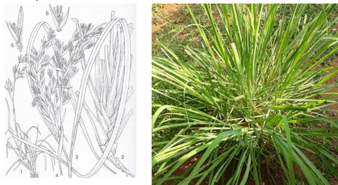
Gambar 1. Kiri. Cymbopogon citratus (DC.) Stapf. 1. Habitus tanaman yang sedang berbunga; 2. Plat basal; 3. Daun dua; 4. Bagian dari inflorescence; 5. Sepasang spikelet; 6 spikelet sesil yang fertil (Oyen dan Dung, 1999); Kanan. Perawakan C. citratus (dokumentasi pribadi).

Cymbopogon citratus merupakan tanaman menahun, berumbai dan merupakan rumput-rumputan yang menghasilkan aroma dengan culm yang tegak. Culm (batang) berukuran hingga 2-3 m tingginya, dan padat dibagian bawah (Oyen dan Dung, 1999). Daun memiliki seludang keras, berbentuk bulat dan memiliki ligula atau lidah daun. Helaian daun berbentuk pita dengan ukuran 50-100 cm x 0,5- 2,0 cm dengan bagian apek meruncing (acuminate), bergelombang dan tulang daun permanen terdapat di bagian permukaan bawah daun. Pembungaan ( inflorescence ) besar, longgar dengan panikulabernodus dengan tinggi mencapai 60 cm dan memiliki nodus sekitar 4-9 buah dengan memiliki banyak percabangan. Bunga berbentuk spikelet dan biji berbentuk cariopsis dengan hilum dibagian basalnya (Gambar 1).