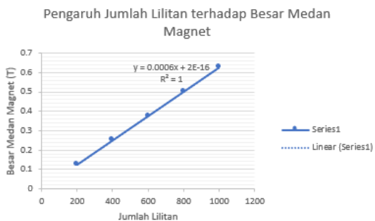
Gambar 3. Grafik Hasil Perhitungan Teoritis Medan Magnet Solenoida

Hasil simulasi pada Gambar 2 dan hasil perhitungan teoritis pada Gambar 3 menunjukkan adanya hubungan linier antara jumlah lilitan solenoida dan besar medan magnet yang dihasilkan. Pola kenaikan nilai medan magnet terhadap pertambahan jumlah lilitan menggambarkan bahwa kuat medan magnet (B) berbanding lurus dengan jumlah lilitan (N) sesuai dengan Hukum Ampère, yang menyatakan bahwa kuat medan magnet (B) berbanding lurus dengan jumlah lilitan (N) dan arus listrik (I), serta berbanding terbalik dengan panjang solenoida (L) (Prastyaningrum & Imansari, 2023). Fenomena ini terjadi karena setiap lilitan menghasilkan medan magnet kecil yang saling memperkuat di sepanjang sumbu solenoida, sehingga total medan magnet menjadi semakin besar (Muddasir & Khotimah, 2025).