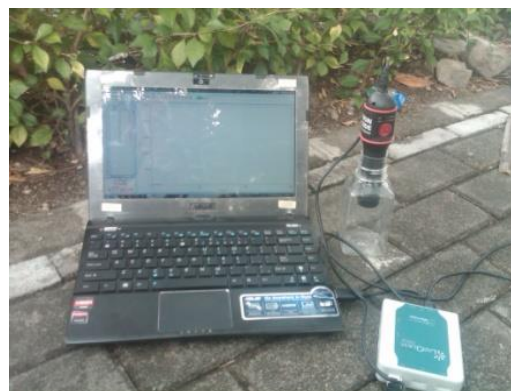
Gambar 1. Rangkaian alat percobaan