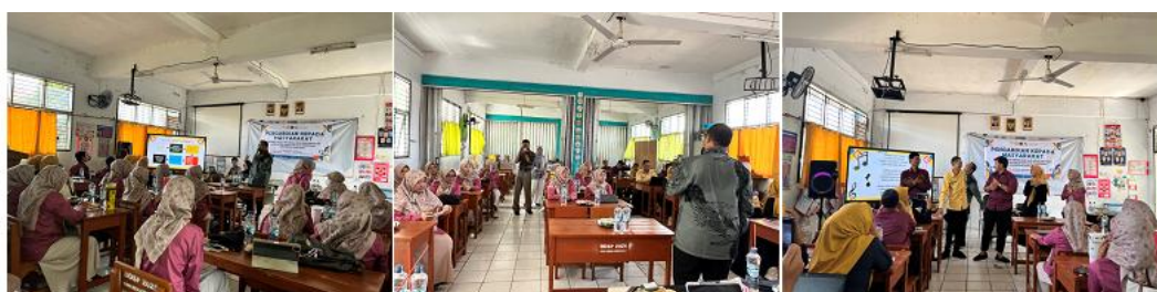
Gambar 2. Dokumentasi Pelaksanaan Pelatihan Pemanfaatan Lingkungan Sekolah

Selama pelaksanaan kegiatan, guru menunjukkan antusiasme dan partisipasi yang tinggi, yang terlihat dari keaktifan dalam diskusi, keterlibatan langsung dalam praktik penyusunan perangkat pembelajaran, serta keseriusan dalam mengikuti seluruh rangkaian kegiatan. Respons guru terhadap materi pembelajaran berbasis lingkungan juga sangat positif, karena materi dinilai relevan dengan kebutuhan pembelajaran di sekolah dasar dan mudah diterapkan dalam kegiatan belajar mengajar sehari-hari. Guru menyampaikan bahwa pendekatan pembelajaran berbasis lingkungan mampu menjadi alternatif strategi pembelajaran yang lebih variatif, menarik, dan kontekstual, sehingga berpotensi meningkatkan motivasi belajar siswa. Dokumentasi pelaksanaan kegiatan pelatihan, meliputi penyampaian materi, diskusi, dan praktik penyusunan perangkat pembelajaran, disajikan pada Gambar 2 sebagai bukti pelaksanaan kegiatan Pengabdian Kepada Masyarakat.