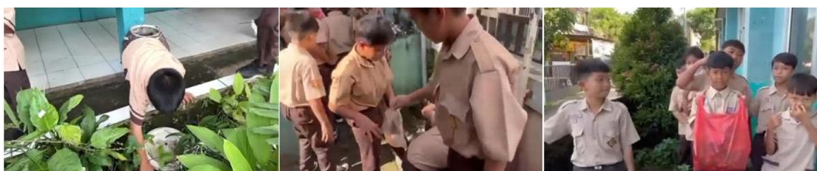
Gambar 5. Aktivitas Siswa dalam Kegiatan Peduli Lingkungan Sekolah sebagai Dampak Tidak Langsung Penerapan Pembelajaran Berbasis Lingkungan oleh Guru

Pembelajaran yang mengintegrasikan lingkungan sebagai media belajar mendorong siswa untuk memahami pentingnya menjaga lingkungan tidak hanya sebagai kewajiban, tetapi sebagai bagian dari tanggung jawab pribadi dan sosial. Proses pembiasaan karakter peduli lingkungan ini semakin kuat karena dilakukan secara berulang melalui kegiatan pembelajaran dan aktivitas rutin sekolah setelah kegiatan PkM dilaksanakan. Guru juga melaporkan adanya perubahan sikap siswa dalam bentuk meningkatnya rasa tanggung jawab, kedisiplinan, dan kepedulian terhadap lingkungan sekitar, baik di sekolah maupun di luar sekolah. Pembiasaan karakter peduli lingkungan yang terbentuk melalui pembelajaran berbasis lingkungan ini menunjukkan bahwa pendekatan kontekstual dan pengalaman langsung mampu menanamkan nilai karakter secara lebih efektif dibandingkan pembelajaran yang bersifat teoritis. Dokumentasi aktivitas siswa dalam kegiatan peduli lingkungan disajikan pada Gambar 5 sebagai bukti perubahan perilaku dan pembiasaan karakter peduli lingkungan siswa pasca pelaksanaan kegiatan PkM. Aktivitas siswa pada gambar berikut merupakan hasil penerapan pembelajaran berbasis lingkungan oleh guru setelah mengikuti kegiatan pelatihan.