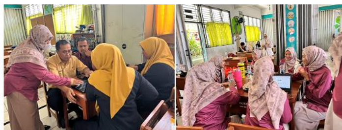
Gambar 3. Penyusunan Perangkat Pembelajaran Berbasis Lingkungan

Guru tidak hanya memanfaatkan lingkungan sebagai latar pembelajaran, tetapi juga sebagai media utama dalam menyampaikan materi. Hasil posttest yang diberikan setelah pelatihan menunjukkan adanya peningkatan pemahaman guru terkait konsep dan penerapan pembelajaran berbasis lingkungan dibandingkan dengan hasil pretest. Produk perangkat pembelajaran yang dihasilkan oleh guru, seperti RPP dan modul ajar berbasis lingkungan, menjadi bukti konkret bahwa guru telah mampu mengimplementasikan materi pelatihan ke dalam praktik perencanaan pembelajaran. Dokumentasi penyusunan perangkat pembelajaran oleh guru disajikan pada Gambar 3 sebagai bukti peningkatan kompetensi pedagogis guru dalam memanfaatkan lingkungan sekolah sebagai media pembelajaran.