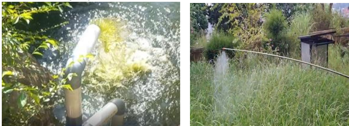
Gambar 3. Pengujian Pompa Air dan Spray Tenaga Surya

Teknologi spray portable tenaga surya yang dikembangkan dalam kegiatan ini dirancang khusus untuk menurunkan biaya operasional penyiraman dan meningkatkan efisiensi waktu. Adapun spesifikasi alat yang telah diterapkan kepada kelompok tani adalah panel surya 72 sel 350 WP, baterai 12 volt 120 Ah, pompa DC 12V, kapasitas 5–7 liter/menit, inverter 1000 watt PSW, tabung pemipil silinder 12 inch yang dilengkapi bilah pemipil, rangka mesin dibuat dari besi hollow 4x6 (100 x 80 x 100) dan dilengkapi empat roda 12 inch, menjadikan alat ini bersifat mobile , mudah dipindahkan. Setelah menggunakan alat spray portable tenaga surya, penyiraman tanpa biaya bahan bakar karena memanfaatkan energi surya.