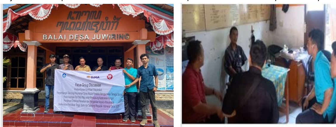
Gambar 2. Pengarahan dan Pemberian Informasi Terkait Penyusunan dan Pengembangan Rancangan Alat Spray Portable

Sosialisasi ini melibatkan seluruh anggota Kelompok Tani Sido Maju untuk memastikan bahwa mereka memahami permasalahan yang ada dan kontribusi mereka dalam solusi yang akan diimplementasikan. Pelaksanaan kegiatan PkM mendapatkan respons sangat baik dari mitra. Keterlibatan anggota kelompok tani tergolong tinggi, yaitu sebanyak 9 orang hadir penuh mengikuti seluruh rangkaian kegiatan 10 orang anggota kelompok tani atau 90% keterlibatan aktif. Peningkatan pengetahuan petani diukur melalui pre-test dan post-test pada tiga aspek utama, yaitu: (1) pengetahuan tentang komponen alat spray portable dan (2) pemahaman tentang cara perawatan dan troubleshooting ringan. Hasil pengukuran menunjukkan peningkatan signifikan, yaitu pengetahuan komponen alat meningkat dari 48% menjadi 90% ( \pm 42\% ). Pemahaman perawatan meningkat dari 40% menjadi 85% ( \pm 45\% ). Secara keseluruhan, terjadi rata-rata peningkatan pengetahuan sebesar 43,5%, yang menunjukkan bahwa pelatihan berhasil mentransformasi pemahaman dan kemampuan teknis petani.