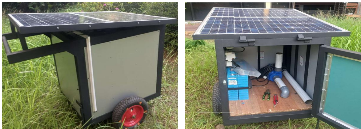
Gambar 5. Alat Spray Portable