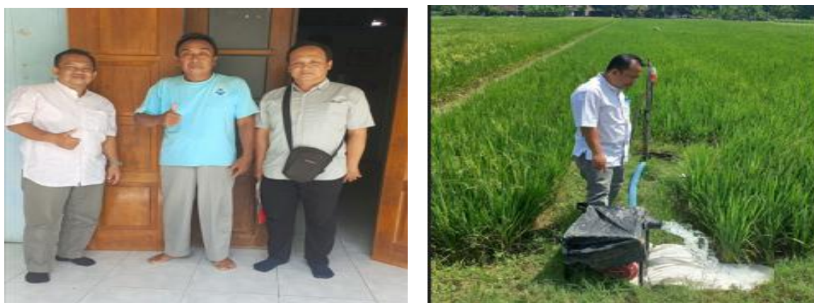
Gambar 1. Sosialisasi tim PkM dengan Ketua Poktan dan survei lokasi lahan pertanian Dengan rangkaian tahapan ini, diharapkan program PkM tidak hanya menyelesaikan masalah jangka pendek akan tetapi juga mendorong kemandirian, produktivitas, dan transformasi teknologi yang berkelanjutan di kalangan petani desa.