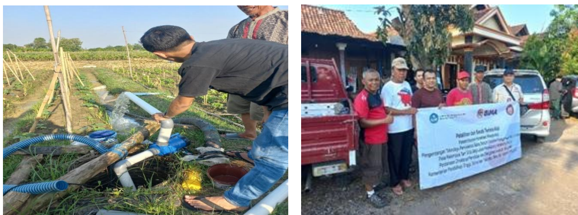
Gambar 6. Proses Penyiraman di Lahan Mitra dan Serah Terima Alat