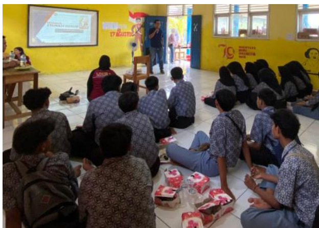
Gambar 2. Instruksi simulasi

Simulasi terbukti menjadi metode paling efektif. Saat diberikan skenario konflik atau perundungan, sebagian besar kelompok mampu menampilkan solusi yang berdasarkan nilai moral, empati, dan komunikasi positif. Observasi menunjukkan bahwa siswa lebih berani menyampaikan pendapat dan mencoba mengelola konflik secara asertif. Pada akhir kegiatan, 81% kelompok mampu mengidentifikasi tindakan pencegahan yang tepat, dan 73% siswa berhasil memainkan peran sebagai penengah konflik dengan baik.