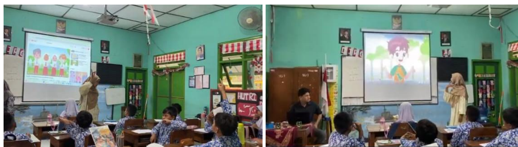
Gambar 1. Edukasi Video Animasi Sex education

Setelah pelaksanaan pre-test , mahasiswa melanjutkan dengan penyampaian materi kepada siswa kelas 3 SD mengenai pendidikan seks melalui video animasi berbasis LVEP . Video ini dirancang khusus agar mudah dipahami oleh anak usia 8–9 tahun, dengan penyampaian yang sederhana, visual yang ramah anak, dan muatan nilai yang relevan. Materi mencakup pemahaman dasar tentang menjaga kesehatan dan keselamatan tubuh, serta pentingnya mengenali tindakan yang tidak pantas dan bagaimana meresponsnya dengan benar.