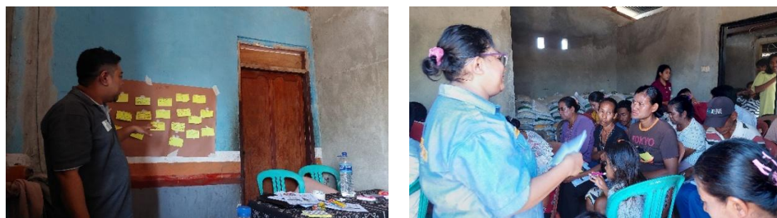
Gambar 2. Penyampaian Materi dan Pemetaan Jawaban Pada Saat Diskusi di Desa Maubokul

Survei terhadap pelaksanaan sosialisasi memuat tujuh indikator penilaian, terkait waktu pelaksanaan, kegiatan sesuai dengan kebutuhan masyarakat, pelayanan panitia pelaksana, ruangan kegiatan, serta narasumber. Hasilnya dapat dilihat pada tabel di bawah ini: