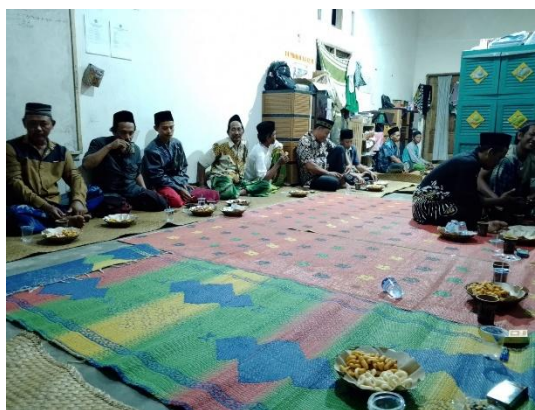
Gambar 3. Musyawarah dengan wali santri dan dewan asatidz

Tahap to plan dilaksanakan pada tanggal 4 Mei 2024, tim melibatkan pengasuh, wali santri dan dewan asatidz dalam forum musyawarah terkait rencana pemecahan masalah yang telah di ungkapkan oleh pengasuh, tim pengabdian memberikan rancangan tentang pengajian kitab Nasoihul Ibad dengan skema kajian tiap minggu, dan diakhir pertemuan para santri di berikan tugas yang wajib dilaksanakan sebagai bagian dari evaluasi dari materi yang telah di ajarkan.