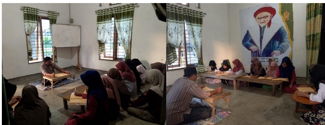
Gambar 4. Pelaksanaan pengajian kitab Nasoihul Ibad

Tahap to act dilaksanakan selama enam bulan mulai tanggal 11 Mei – 12 Oktober 2024, santri yang mengikuti kajian kitab ini sebanyak 15 santri, Setiap sesi diawali dengan pembacaan teks kitab, penjelasan kandungan oleh narasumber, kemudian praktek membaca kitab oleh santri dan diakhiri dengan refleksi nilai-nilai yang dapat diterapkan dalam kehidupan sehari-hari. Fokus pembelajaran diarahkan pada kemampuan membaca, pemahaman isi dan penguatan akhlak seperti kejujuran, tanggung jawab, kepedulian, serta disiplin. Dengan adanya praktek membaca kitab ini diharapkan santri bisa mandiri dengan pemahaman yang luas dan kemudian menciptakan generasi yang bisa membaca kitab untuk adik tingkatnya sehingga pesantren memiliki tenaga pengajar dilingkup pesantren.