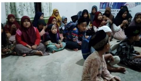
Gambar 2. Santri kelas shogir.

Tahap to plan dilaksanakan pada tanggal 4 Mei 2024, tim melibatkan pengasuh, wali santri dan dewan asatidz dalam forum musyawarah terkait rencana pemecahan masalah yang telah di ungkapkan oleh pengasuh, tim pengabdian memberikan rancangan tentang pengajian kitab Nasoihul Ibad dengan skema kajian tiap minggu, dan diakhir pertemuan para santri di berikan tugas yang wajib dilaksanakan sebagai bagian dari evaluasi dari materi yang telah di ajarkan.