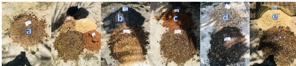
Gambar 2. Media Tanam Sirih Gading

Pada tahap kegiatan ini, peserta terlihat menyimak setiap langkah-langkah yang disampaikan. Pelatihan/praktek langsung menjadi pilihan tahapan dalam kegiatan pengabdian masyarakat sebab pelatihan mengandung proses pembelajaran untuk meningkatkan ketrampilan, dengan waktu yang relatif singkat dan metode yang lebih mengutamakan praktek daripada teori. Masing-masing peserta kegiatan melakukan penanaman sirih gading dengan variasi jenis dan ukuran bibit sirih gading yang digunakan. Varietas sirih gading digunakan dalam kegiatan ini antara lain sirih gading hijau kuning dan sirih gading hijau. Perbedaan varietas sirih gading yang digunakan akan menjadi dasar bagi peserta untuk memahami karakter setiap jenis sirih gading khususnya terkait proses perawatannya.