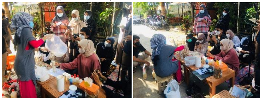
Gambar 1. Kegiatan Workshop dan Diskusi

Workshop dan diskusi dilaksanakan di Komplek Griya Prima Asri, Jl. Elang I C5 No. 4, Desa Bojongmalaka, Kecamatan Baleendah, Kabupaten Bandung memperlihatkan antusiasme peserta kegiatan yaitu terlihat dari seringnya dialog aktif antara pemateri dan peserta khususnya terkait cara pembuatan, variasi bentuk dan teknik stek, serta cara perawatannya. Secara umum peserta sudah mengetahui teknik dasar menanam tanaman, namun masih belum tepat dalam teknik menanam, komposisi media tanam, dan pemeliharannya.