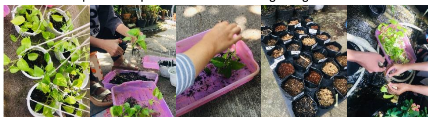
Gambar 4. Proses stek sirih gading

Pemahaman ini akan mudah dipahami oleh peserta dengan cara praktek langsung pembuatan stek sirih gading dengan berbagai varietas sirih gading dan umur atau ukurannya. Dengan demikian, diharapkan peserta mampu membuat stek sesuai dengan kondisi tanaman yang akan digunakan dan media tanam nya. Sehingga secara tidak langsung, peserta tidak mengalami kerugian akibat kematian bibit yang digunakan dalam pelatihan pembuatan stek sirih gading.