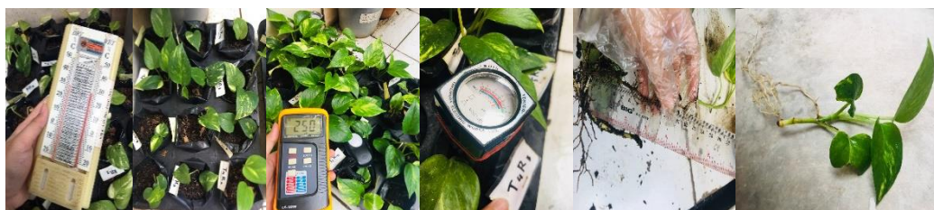
Gambar 5. Hasil evaluasi penanaman stek sirih gading

Hasil penanaman stek sirih gading diserahkan ke masing-masing peserta kegiatan agar dilakukan perawatan di rumah masing-masing. Setelah beberapa minggu kemudian baru dilakukan evaluasi terhadap pertumbuhan vegetatif tanaman tersebut. Hasil evaluasi kegiatan pengabdian masyarakat dilakukan dengan membagikan kuisisioner kepada peserta sebagai responden (sampel terbatas). Setelah dievaluasi maka dapat diketahui bahwa kegiatan yang telah dilaksanakan memberikan dampak baik namun belum optimal sehingga harus mengulang beberapa tahapan kerjanya.