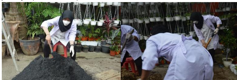
Gambar 3. Pencampuran media tanam

Pemeliharaan tanaman Sirih Gading ( Epipremnum aureum ) tidak sulit, tetapi harus konsisten agar tanaman tetap tumbuh subur. Perawatan yang dilakukan, di antaranya adalah media tanam yang digunakan, pemupukan, pencahayaan, suhu, dan penyiraman. Tanaman Sirih Gading ( Epipremnum aureum ) dapat tumbuh pada tempat yang tidak terkena cahaya secara langsung, karena daunnya cenderung mudah terbakar. Untuk penyiraman pada tanaman ini dapat dilakukan pada pagi hari agar dapat berfotosintesis dengan baik, karena jika penyiraman dilakukan di sore hari maka tanaman akan lembap dan cepat membusuk. Jumlah air yang digunakan untuk penyiraman tidak terlalu banyak agar daunnya tidak cepat layu (Kania, 2021).