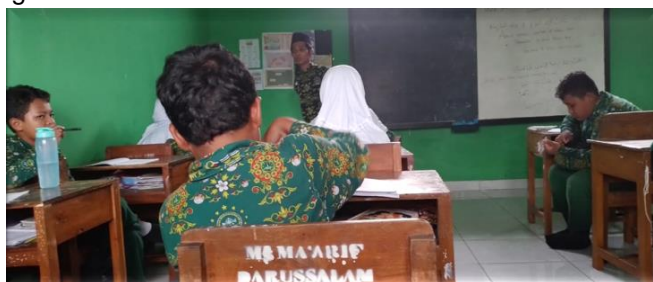
Gambar 1. Variasi Gaya Mengajar dengan Perpindahan Posisi dan Kontak Pandang untuk Pemusatan Perhatian Siswa

Variasi gaya mengajar meliputi penggunaan variasi suara, pemusatan perhatian siswa, penggunaan kesenyapan, melakukan kontak mata, gerakan tubuh dan ekspresi wajah, serta posisi yang diambil oleh selama guru proses pembelajaran (Nuswawati & Aini, 2021). Variasi gaya mengajar guru dapat dilihat pada gambar berikut ini.